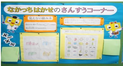
各階掲示板の算数コーナー

子どもたちの学力向上のために、毎週水曜日の朝自習の時間に算数タイムを継続しています。学年全体を4グループに分け、タイムを決めて計算練習に取り組んでいる学年もあります。同じ問題を何度も繰り返して行い、スキルアップを図っています。時間とやり方が決まっているので、皆集中して取り組んでいます。引き続き学習環境作りや指導力向上に努めてまいります。