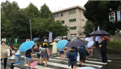
始業式の日『朝のあいさつ運動』 教育委員会と教職員全員で 子どもたちを迎えました。