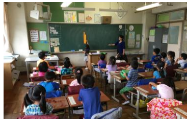
二学期開始二日目ですが、 1年生も、しっかりと お勉強モードです！