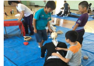
『中新田かかしまつり』は、 9月3日から19日まで。 5年生は準備で大忙しでした。