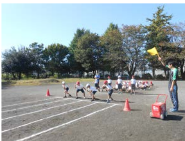
一回に測定できる人数が多いので、効率よく実施できました

子どもたちは、多くの学生さんにアドバイスをもらったり、また、手本を見せてもらったりして、間違いなくやる気を出して取り組み、結果も上がったことと思います。また、保護者ボランティアの方、学校応援団の方も、合わせて20名ほどが力を貸してくださいました。