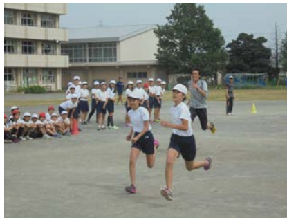
女子のリレー選手とのハンディ走 ハンディを付けすぎて女子の勝ち！