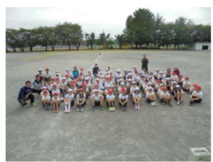
全員で記念写真。校長室に サインをもらいに来る子が多数！