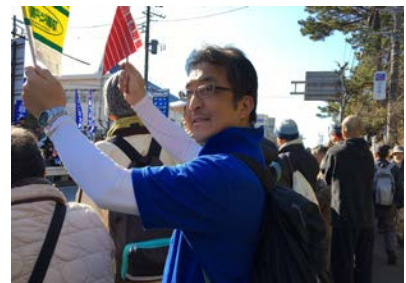
声援を送るワッシー校長

始業式で、子どもたちにも話しましたが、一月三日に、箱根駅伝の応援に行きました。復路8区の難所の一つである、藤沢の遊行寺の坂を応援の場所を選びました。驚いたのは、応援する人の多さ！一つの区間を走る間に、何千人何万人もの声援を受け、間違いなく、選手たちに力を与えるのだろうか、とつくづく感じました。応援される、期待されることが、人を動かす原動力になります。中新田小学校がそういう存在であるように、この一年頑張ってください。応援、よろしくお願ひします。