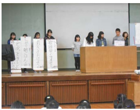
児童保健委員会の劇で良い生活リズムのポイントを教えてくださいました。