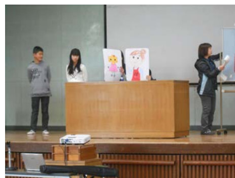
「中っちと中子」も登場。工夫して分かりやすく発表しました。