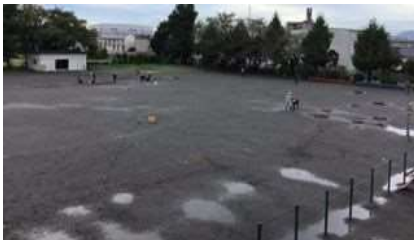
当日、朝の校庭整備の様子