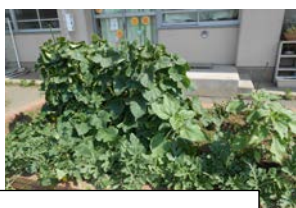
ひまわり級 野菜畑