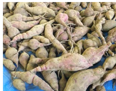
夢中でお芋を掘るこどもたち